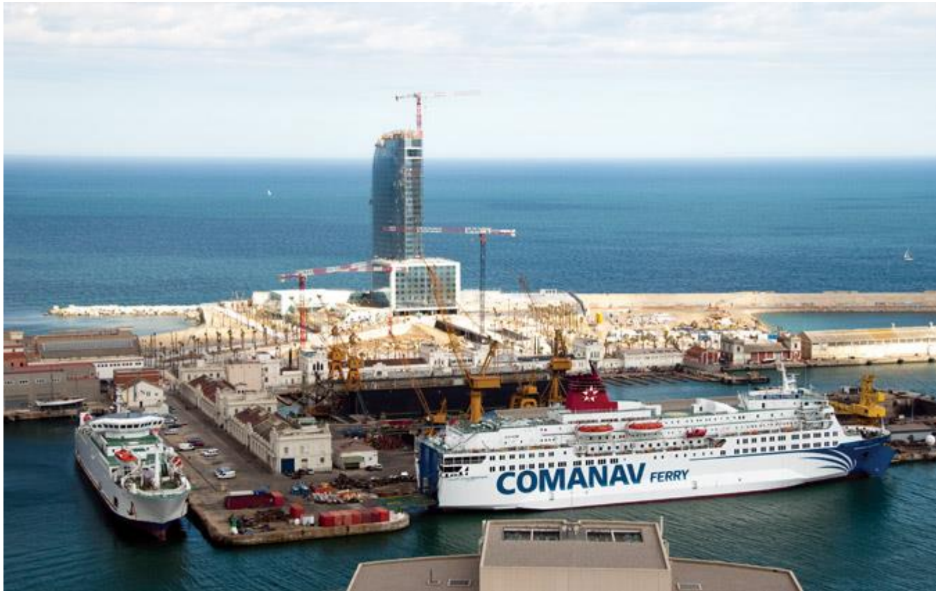
Район строительства отеля Vela в Барселоне (2009)

- Расскажите, как принимаются решения о строительстве того или иного объекта в Испании и в Барселоне? Есть ли какое-то подобие художественного совета? Как, по Вашему мнению, случается, что даже на знаменитом Пасео дэ Грасиа появляются совершенно чудовищные здания, абсолютно не вписывающиеся в окружающую эстетику?