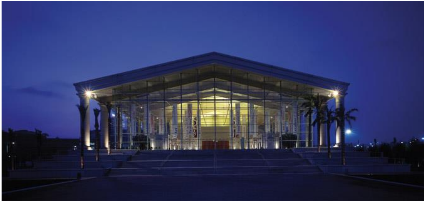
Национальный театр Каталонии в Барселоне