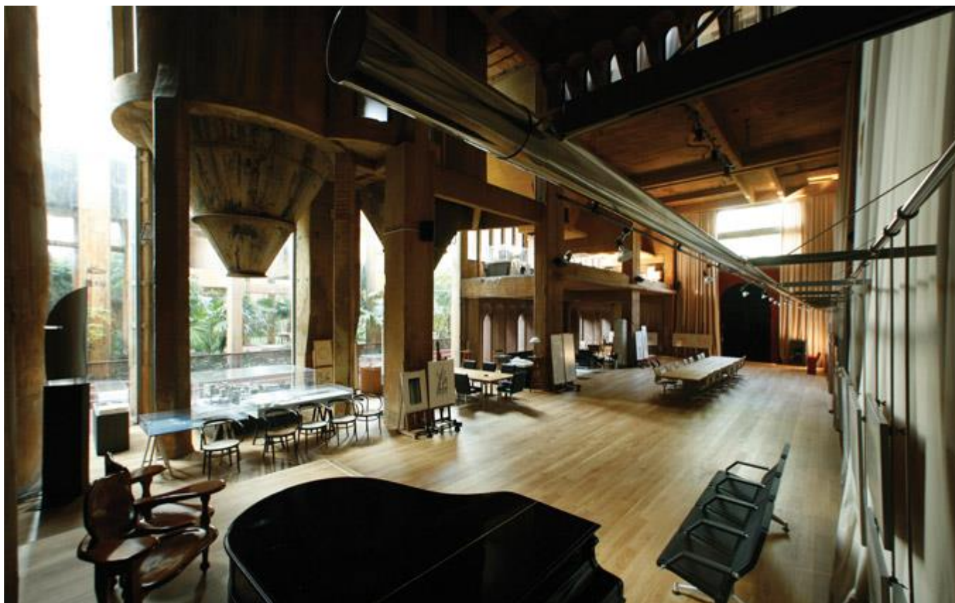
Мастерская Рикардо Бофилла под

Барселонной оборудована в здании бывшего цементного завода