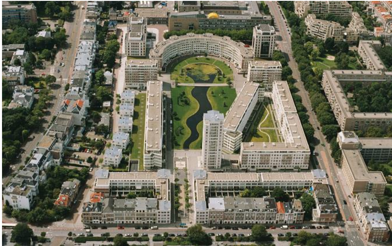
Квартал Monchyplein в Гааге, Голландия