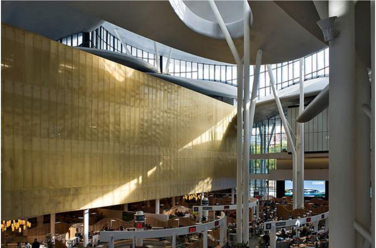
Дом юстиции в Тбилиси (2012).

– Авангард мертв. Знаете почему? Авангард – это мечты о том, что невозможно построить. Сейчас ты можешь придумать самый безумный проект – хороший, плохой – не важно, – и реализовать его. Утопия невозможна.